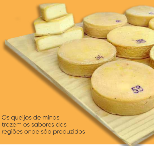
Os queijos de Minas trazem os sabores das regiões onde são produzidos

A classificação do TasteAtlas é feita por meio das avaliações dos usuários do site. Portanto, as notas não são baseadas em opiniões de profissionais ou especialistas em gastronomia, mas na percepção do consumidor final dos produtos.