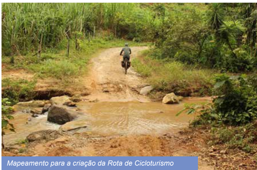
Mapeamento para a criação da Rota de Cicloturismo

Primeira rota regional de cicloturismo recebe investimento para criação de identidade visual, sinalização e planejamento de marketing