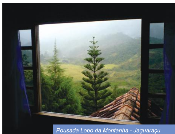
Pousada Lobo da Montanha - Jaguarapu