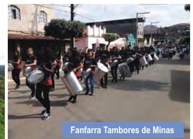
Fanfarra Tambores de Minas