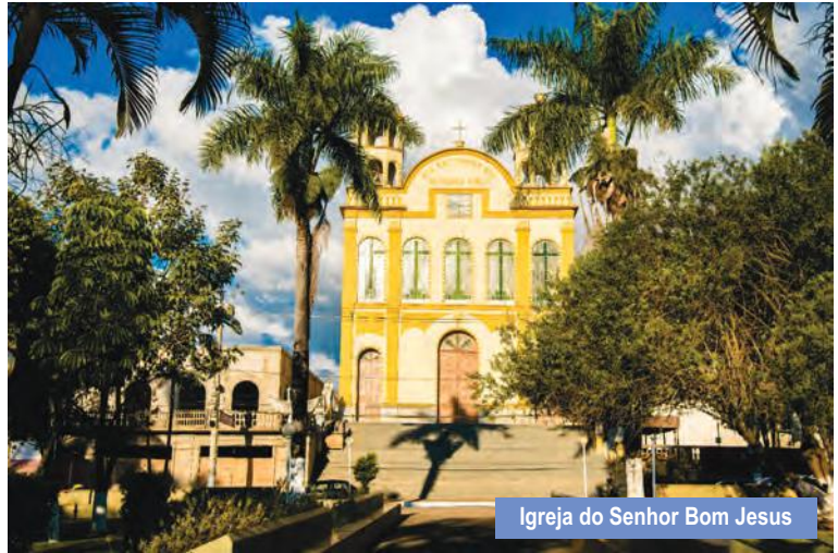
Igreja do Senhor Bom Jesus