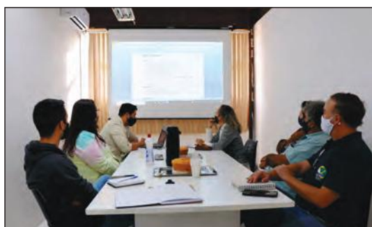
Santana do Paraíso pretende ser reconhecida nos principais pólos emissores do estado de Minas Gerais como um destino de turismo natural e de esportes de aventura