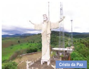
Cristo da Paz