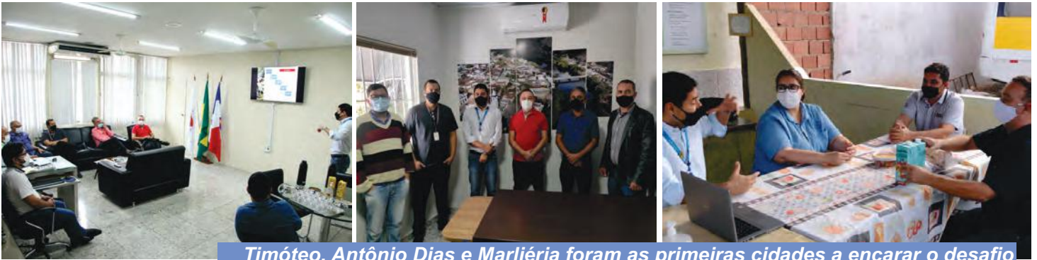
Timóteo, Antônio Dias e Marliéria foram as primeiras cidades a encarar o desafio