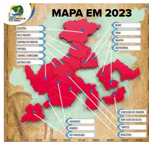
Em 10 anos, o CTMAM ampliou sua área territorial passando de 8 para 17 cidades associadas

principais ações do CTMAM tem sido a de agregar novos associados, em 2013, eram apenas oito associados: Açucena, Belo Oriente, Coronel Fabriciano, Ipatinga, Marliéria, Santana do Paraíso, São Domingos do Prata e Timóteo. Desde então, mesmo com a saída de algumas cidades, que diversos motivos se associaram a outras IGRs, o CTMAM teve um crescimento na casa de 108%, chegando às atuais 17: Açucena, Antônio Dias, Belo Oriente, Bom Jesus do Galho, Bugre, Conceição de Ipanema, Coronel Fabriciano, Dionísio, Ipaba, Inhapim, Ipatinga, Jaguarçu, Marliéria, Santana do Paraíso, Rio Piracicaba, Timóteo, Ubaporanga. Desses, 12 foram habilitados para receber, este ano, os repasses do ICMS Turismo e a tendência é que nos próximos anos, todos alcancem esse direito.